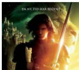
FILM: Legenden om Narnia - Prins Caspian

- Hva er styrken i et kristent fellesskap?